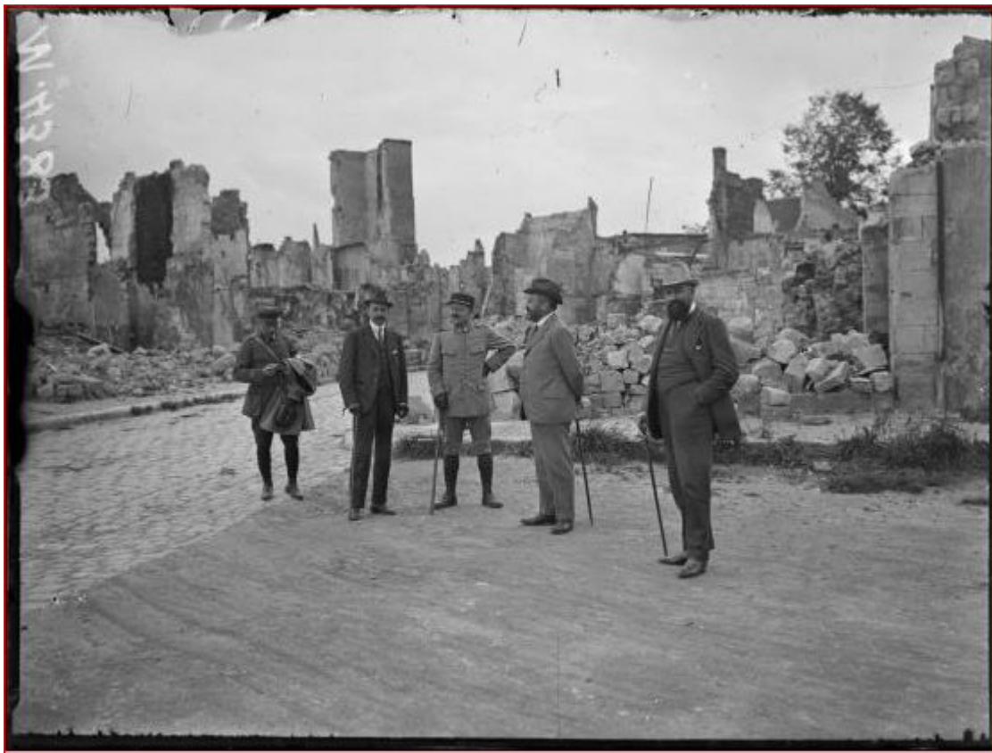
Poincaré avec les plénipotentiaires espagnols