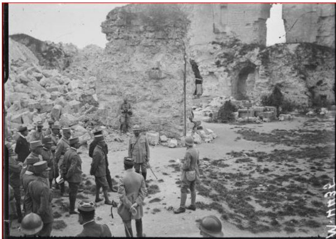
visite du Roi d'Italie avec Poincaré