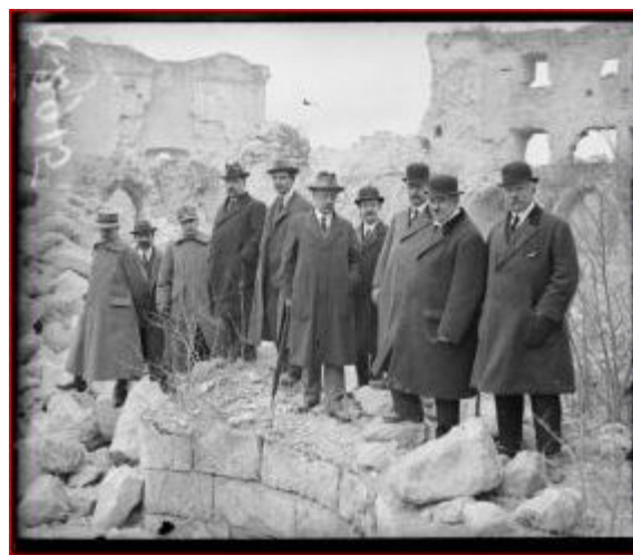
Avec des envoyés de plusieurs autres pays